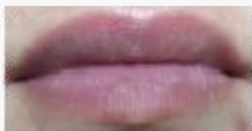
Controle - Imediato