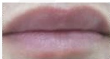
Antes da Aplicação

Seu efeito plumping também foi avaliado e o aumento labial torna-se perceptível já na primeira aplicação.