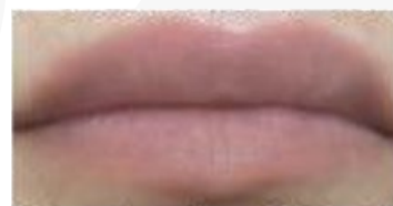
Com Aquajuve™ Omni depois de 4 hs

Referência bibliográfica: Material do fornecedor (Innovasell)