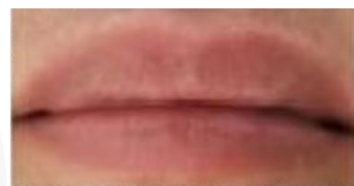
Controle - Depois de 4 hs