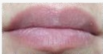
Com Aquajuve™ Omni Imediato